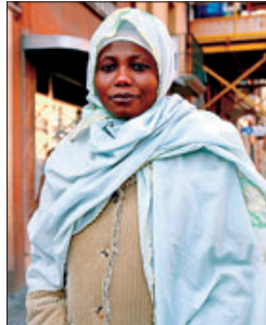
ADDIS TU AMA DE CASA

«El velo y el burka son una discriminación para la mujer y plantean un problema de convivencia. Aquí deberían vestirse como todos»