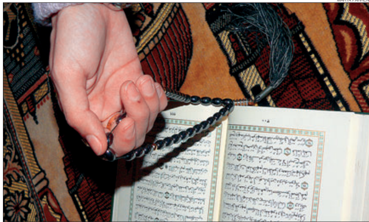
▶▶ Una chica catalana convertida al islam, que prefiere no mostrar su rostro, lee el Corán.

Parece que a las dos compañeras les gusta mucho aleccionarnos so-